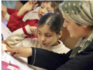
Migranten wollen sich einfügen.

WELLINGHOFEN Eine Studie des Bundesfamilienministeriums räumt mit einem weit verbreiteten Vorurteil auf: Migranten stehen demnach bei weitem nicht unter einem so großen fundamentalistischen Einfluss wie allgemein angenommen. Soweit das Vortrags-Thema des "Runden Tisches Grimmelsiepen".