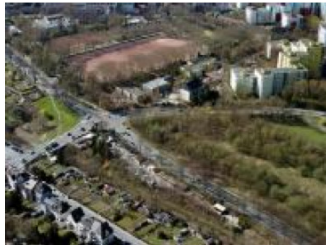
Laut CDU wurde "Am Grimmelsiepen" (das grüne Dreieck rechts im Bild) von Rot-Grün viel Geld verbrannt.

HÖRDE Mit scharfen Geschützen schießt die CDU-Ratsfraktion gegen SPD und Grüne: Unter "dem Deckmäntelchen der Integration" sei "Am Grimmelsiepen" in Hörde ein Millionenbetrag verbrannt worden.